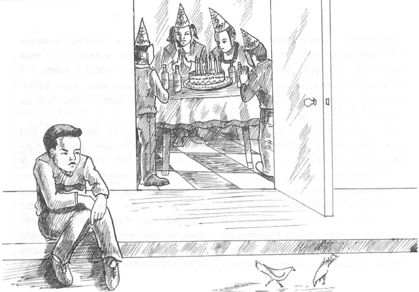
ዓወት፡ ዕለት ልደቱ ዘብዕል ዝነበረ ዓርኩ ክጽውዖ ኢሉ ጭንጎን እናበለ።