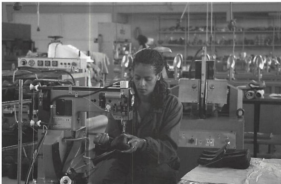
靴・鞆など高級皮革製品はイタリア領時代から続く。主にヨーロッパ市場に輸出されている。

アフリカ諸国の経済再活性化においてTICAD7が期待される重要な役割を考えると、SDGについて動員される国際社会の支援は、アフリカのニーズや要件に合ったものでなくてはなりません。