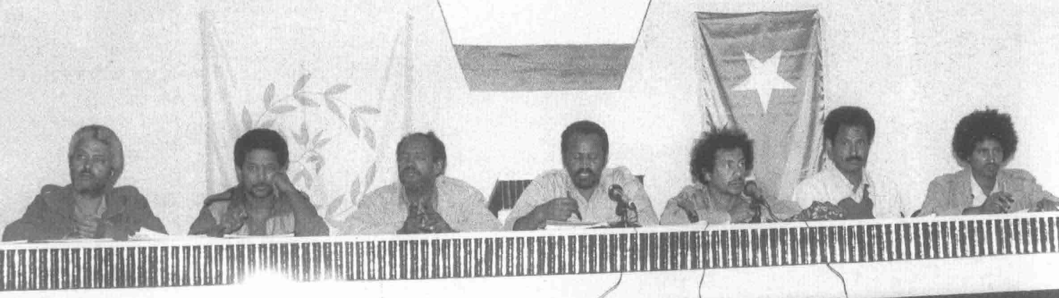
1987年の第二回EPLF・ELF-CL統一会議は、エリトリアの解放運動の政治的成熟に対してのトリビュートであった。会議は過去40年間の闘争を批判的に評価し、国家的・地域的・国際的に支配的な状況を徹底的に考察した。

The Second and Unity Congress of EPLF and ELF-CL held in 1987 was a tribute of the political maturity of the Eritrean movement. The congress critically assessed the past 40 years of national struggle and weighed the prevailing national, regional and international situations thoroughly. It also adopted a new program.