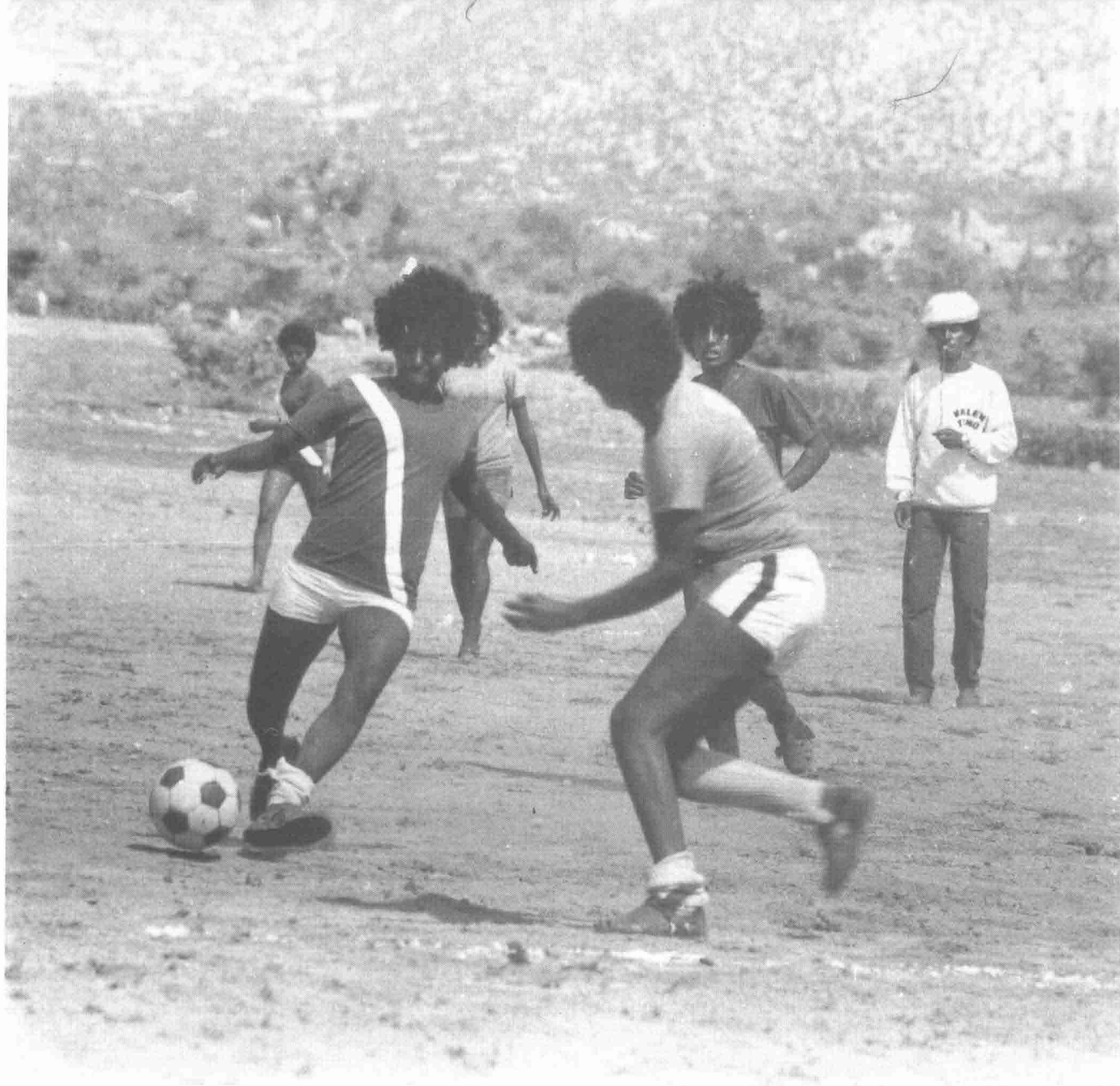
Women team from the freedom fighters. [T]